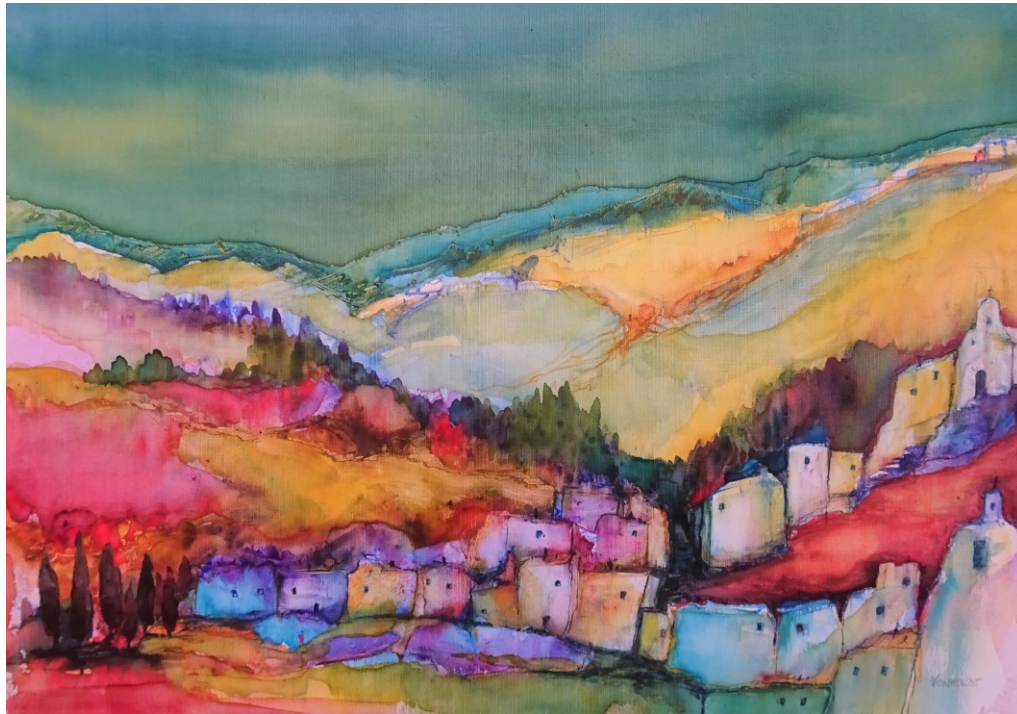
Helena Vonholdt Aquarelle